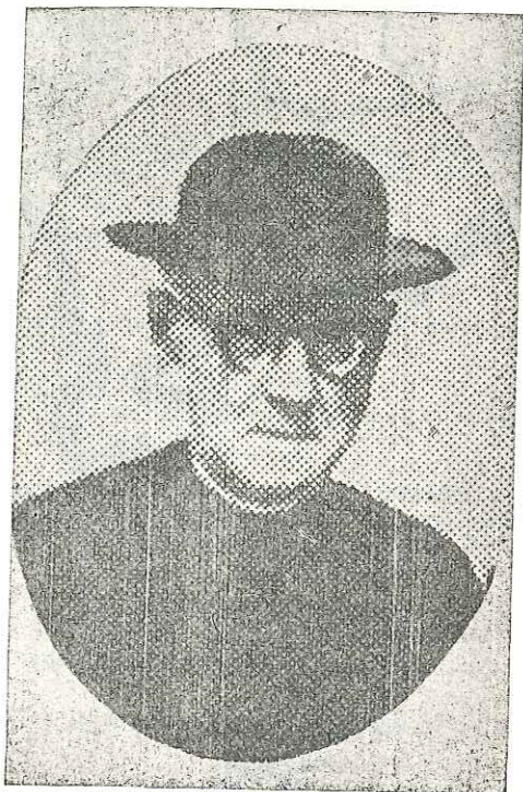
ZAMARRIPA'TAR PAUL LARRO, 1877 - SONDIKA, 1950